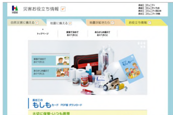
<災害お役立ち情報ウェブサイト>

この他、管理組合様それぞれの状況に合わせてカスタマイズ可能なマニュアルの雛形などもご提供しています。