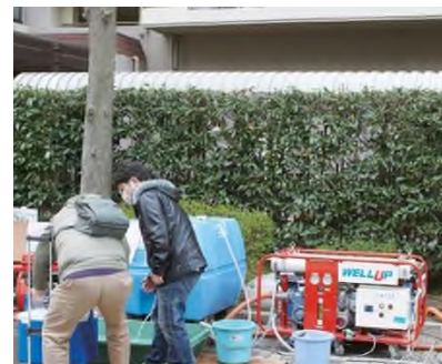
<東日本大震災時のWELL UPの活用事例>